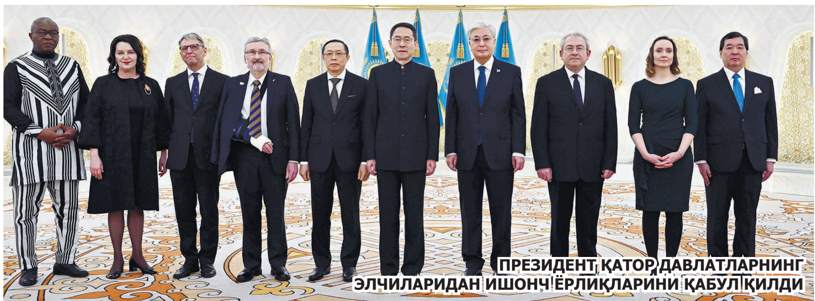
ПРЕЗИДЕНТ, ҚАТОР ДАВЛАТЛАРНИНГ ЭЛЧИЛАРИДАН ИШОНЧ ЁРЛИҚЛАРИНИ ҚАБУЛ ҚИЛДИ