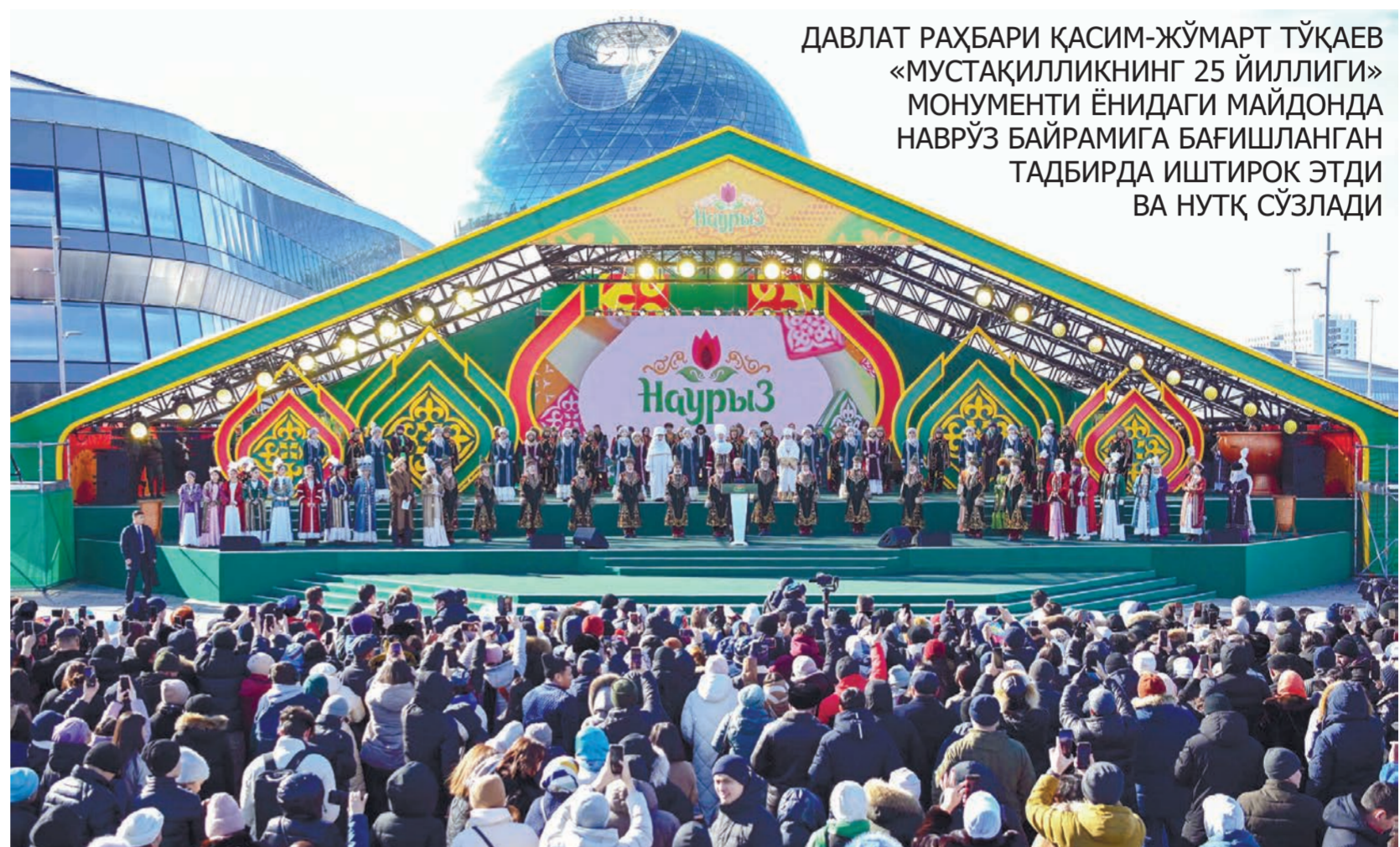
ДАВЛАТ РАҲБАРИ ҚАСИМ-ЖЎМАРТ ТЎҚАЕВ «МУСТАҚИЛЛИКНИНГ 25 ЙИЛЛИГИ» МОНУМЕНТИ ЁНИДАГИ МАЙДОНДА НАВРЎЗ БАЙРАМИГА БАҒИШЛАНГАН ТАДБИРДА ИШТИРОК ЭТДИ ВА НУТҚ СЎЗЛАДИ