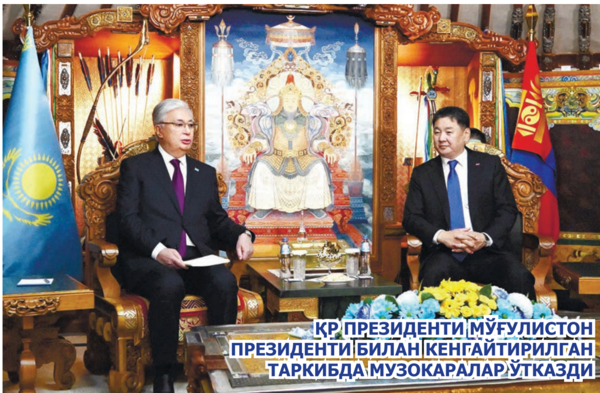
ҚР ПРЕЗИДЕНТИ МЎҒУЛИСТОН ПРЕЗИДЕНТИ БИЛАН КЕНГАЙТИРИЛГАН ТАРКИБДА МУЗОКАРАЛАР ЎТКАЗДИ

Қасим-Жўмарт Тўқаев ва Ухнаагийн Хурэлсух икки мамлакат делегациялари аъзолари иштирокида кенгайтирилган таркибда музокаралар ўтказди.