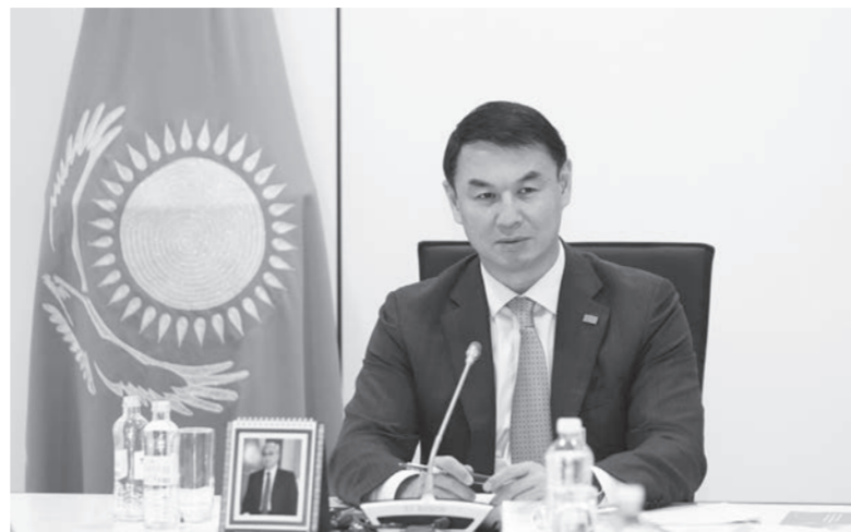
залар бўлди, мутасаддиларга топшириқлар берилди. Йиғилиш якунида комиссия аъзоларининг таклиф ва эслатмалари баённомага киритилди. Ушбу йўналишда ишлар давом эттирилади. Вилоят ҳокимининг матбуот хизмати.

тибалди йўловчилар хавфсизлигини таъминлаш, йўл-транспорт ҳодисаларининг олдини олиш йўналишидаги тадбирларни янада жонлантиришни топширди. Минтақа йўлларини таъмирлаш давом эттирилишини маълум қилди. Мажлисда “Балоғатга етмаганлар ҳамда уларга қарши жиноятларнинг олдини олиш” мавзуида ҳам маъруза