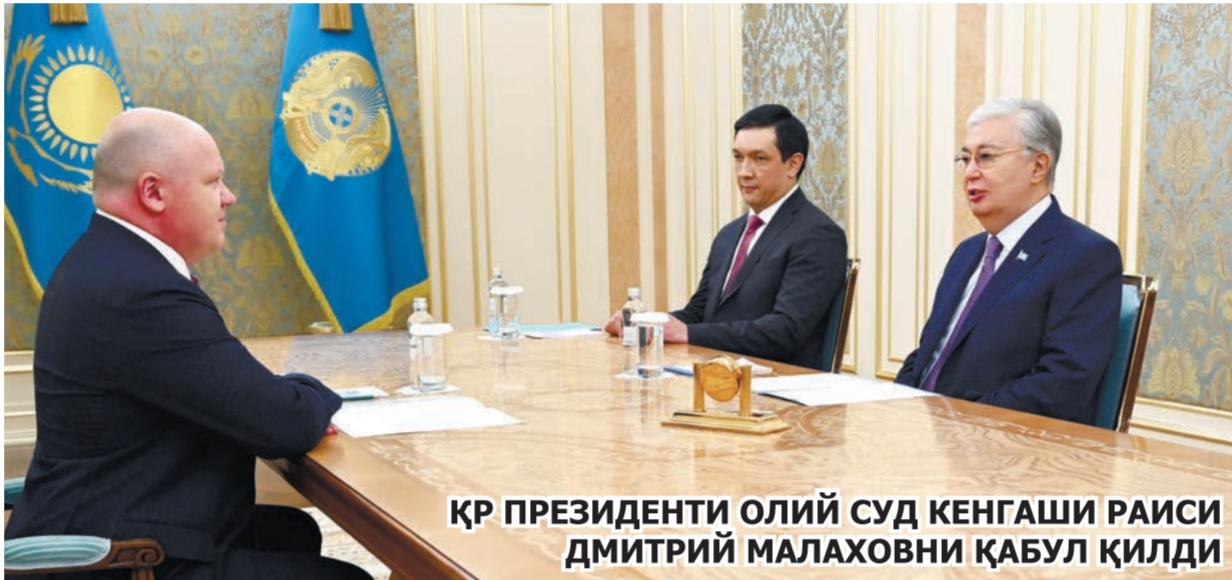
ҚР ПРЕЗИДЕНТИ ОЛИЙ СУД КЕНГАШИ РАИСИ ДМИТРИЙ МАЛАХОВНИ ҚАБУЛ ҚИЛДИ

Президентга кассация судлари келгуси йилнинг 1 июлидан иш бошлаши маълум қилинди. Унга-ча Кенгаш судьяларни танлайди ва суд таркибини шакллантиради.