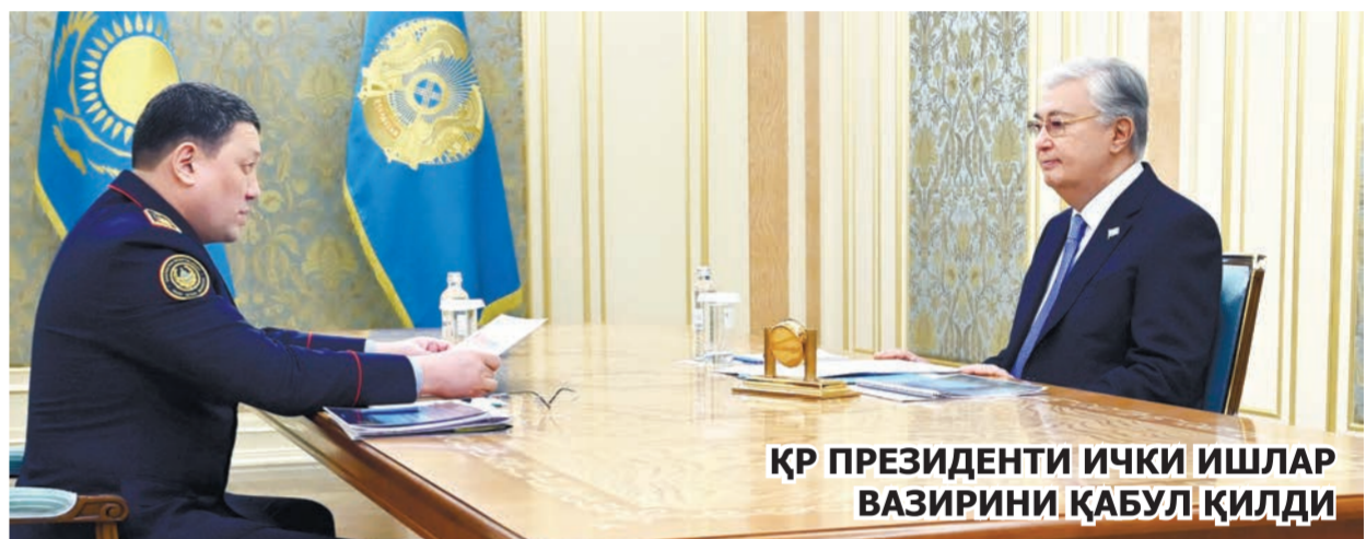
ҚР ПРЕЗИДЕНТИ ИЧКИ ИШЛАР ВАЗИРИНИ ҚАБУЛ ҚИЛДИ

Бундан ташқари, Президентга жазони ижро этиш тизими муасасаларидаги аҳвол ҳақида ахборот берилди.