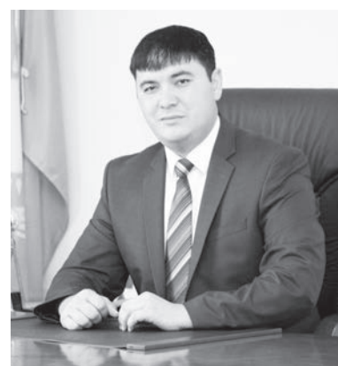
Қозоғистон халқи бирлиги куни арафасида ўтган сессия барчани янгиликлар, Янги Қозоғистонни барпо этишга даъват этди.

гидан мустаҳкамроқ куч йўқлигини таъкидлади. Ички ва ташқи қарши кучларнинг салтбий ташвиқотида алданиб қолмасликка чақирди. Март ойидаги Мақтубда белгиланган вазифаларни ҳаётга татбиқ этишда миллат вакилларини фаолликка чақирди. Сайлов жараёнини ўзгартириш, Парламентга юқори мартабали фуқароларнинг келиши, шунингдек, кўп сонли этник гуруҳларнинг жалб этилиши таъкидланди. Конституциянинг 33-моддасига ўзгартиришлар киритиш кутилмоқда ва барча қозоғистонликларнинг ушбу муҳим воқеада иштирок этиши учун референдум ўтказишга қарор қилганини маълум қилди. Муқаддас Рамазон ойида,