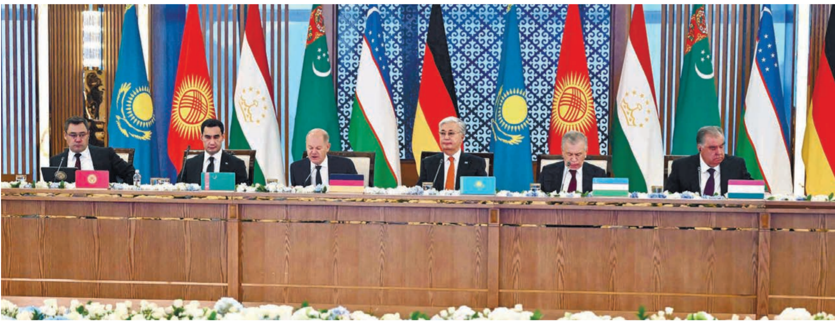
ПРЕЗИДЕНТ МАРКАЗИЙ ОСИЁ ДАВЛАТЛАРИ РАҲБАРЛАРИ, ГФР КАНЦЛЕРИ ВА ЙИРИК НЕМИС БИЗНЕСИ ВАКИЛЛАРИ УЧРАШУВИДА ИШТИРОК ЭТДИ

ҚР Президенти Қасим-Жумарт Тўқаев Федерал Канцлер Олаф Шольцга, Марказий Осие давлатлари президентлари ва немис компаниялари раҳбарларига ўз миннатдорчилигини билдириб, “Марказий Осие – Германия” учрашуви тараққиётнинг янги босқичига йўл очганини таъкидлади.